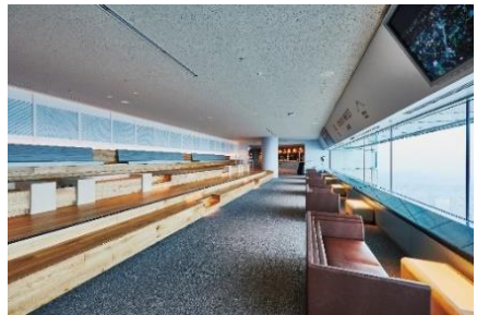
スカイガーデン 南西フロア