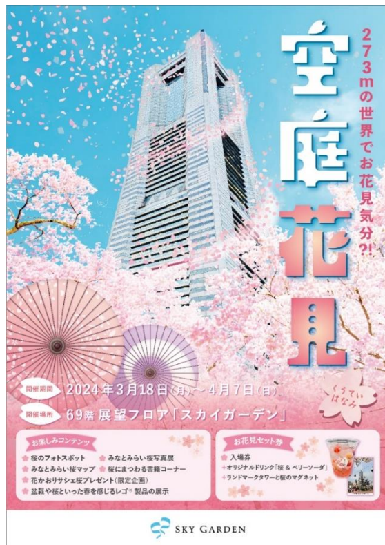
ポスタービジュアル(イメージ)