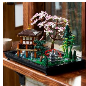
レゴ®ブロック展示(※イメージ) 左から レゴ®盆栽 10281 レゴ®桜 40725 レゴ®アイコン禅ガーデン 10315