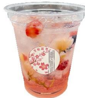
桜&ベリーソーダ (イメージ)