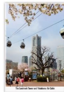
横浜ランドマークタワーと 桜のマグネット (イメージ)