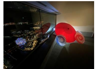
桜のフォトスポット(※イメージ)左：昼間 右：夜