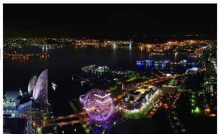
スカイガーデン北東からの眺望(夜景)