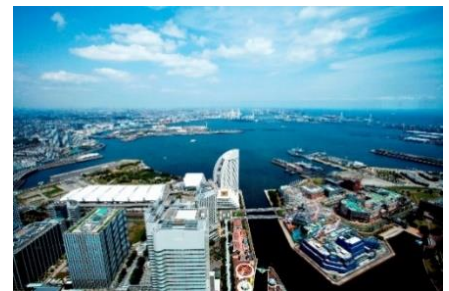
スカイガーデンからの眺望

※ランドマークプラザのSDGsへの取り組み https://www.yokohama-landmark.jp/sdgs/