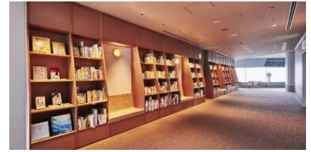
スカイガーデン『横浜・空の図書室』