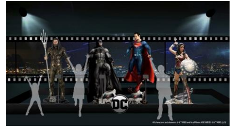
スタチュー展示&フォトスポット ※画像はイメージです

100周年を記念して、様々なDCスーパーヒーロー達がスカイガーデンの地上273mに大集合。景色が映し出されたフィルムに見立てた窓面グラフィックと合わせて、ファンにはたまらないフォトスポットです。