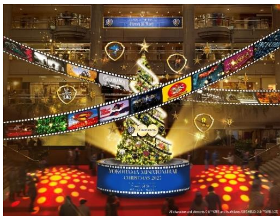
IMAGINATION FILM TREE ※画像はイメージです

※一部日程で、イベント実施予定の為、ツリー全容の撮影ができない場合がございます。予めご了承ください。