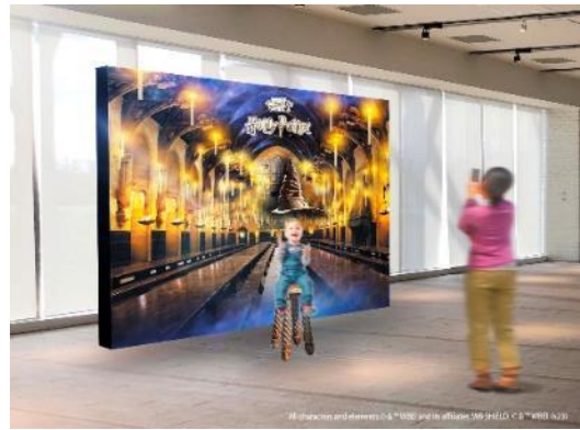
「組分け帽子」コーナー ※画像はイメージです