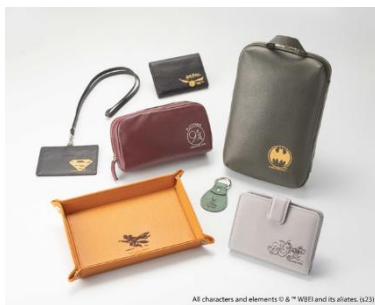
「ワーナー・ブラザーズ刻印 革財布・革小物」 ランドマークプラザ BUSINESS LEATHER FACTORY