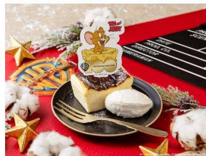
「ジェリー よくばりバスチー」 MARK IS みなとみらい UNI COFFEE ROASTERY

また、ワーナー・ブラザーズの代表作品とコラボレーションした限定アイテムや限定フードの販売を実施するほか、ワーナー・ブラザーズ100周年の歴史を振り返ることができるデジタルスタンプラリーを開催します。