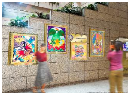
アーティストコラボ作品展示 ※画像はイメージです

2階には、ワーナー・ブラザーズ100周年を記念したアーティストコラボ作品を展示。3階の吹き抜けガラス面には、作品の名言が描かれた映画フィルムが掲出され、4～5階にはクリスマスのお祝いに訪れたキャラクターたちによる、クリスマスフォトスポットが設置されます。館内各所のリースやスワッグにも100周年を記念した特別衣装のキャラクターが登場し、メインツリーから広がったワーナー・ブラザーズの世界観を、ランドマークプラザ館内各所にてご堪能いただけます。