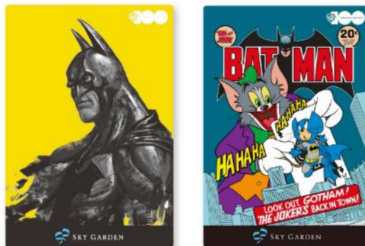
「BATMAN」モチーフのワーナー・ブラザーズ100周年オリジナルデザイン缶バッジ ※画像はイメージです