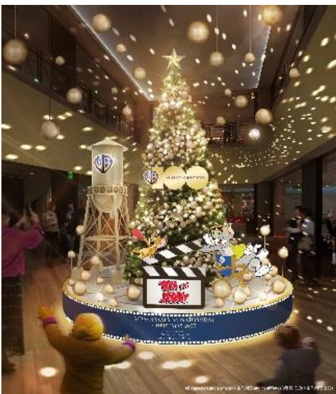
ANIMATION FILM TREE ※画像はイメージです

スカイビル10階には、「トムとジェリー」と「ルーニー・テューンズ」をモチーフにした『ANIMATION FILM TREE』が登場。アニメーションの力が光の結晶となりスカイビルのクリスマスに希望の光を灯します。空間全体が光に包まれたイマジネーションを感じる空間をお楽しみいただけます。