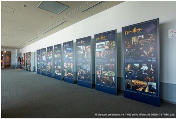
作品介绍パネル展示 ※画像はイメージです