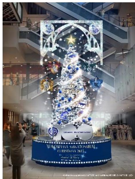
SNOW FILM TREE ※画像はイメージです

※12月23日(土)～25日(月)11:00～13:00はツリー前にてコンサートイベント実施予定のため、ツリー全容の撮影ができません。予めご了承ください。