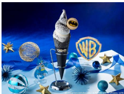
「バットマン アイスクリーム」 69階展望フロア「スカイガーデン」スカイカフェ

今年100周年を迎えたワーナー・ブラザーズと3施設は、みなとみらい地区のクリスマスを彩る様々なコラボレーションを実現いたします。横浜ランドマークタワーでは、ランドマークプラザ 1階にワーナー・ブラザーズの歴代の物語のフィルムに包まれたメインツリー『IMAGINATION FILM TREE』が設置され、各フロアにはアーティストとのコラボ作品やフォトスポットなどが展示されます。69階展望フロア「スカイガーデン」では、「BATMAN」がテーマの特別展示や同フロア内「スカイカフェ」にてコラボドリンク&デザート販売します。MARK IS みなとみらいでは、映画「ハリー・ポッター」シリーズにインスパイアされた『SNOW FILM TREE』の展示や、「ハリー・ポッター」に関する最新コンテンツを堪能することができる「魔法ワールドギャラリー」を展開します。スカイビルには、「トムとジェリー」と「ルーニー・テューンズ」をモチーフにした『ANIMATION FILM TREE』や、アニメーションのスケッチ画(複製)が展示されます。