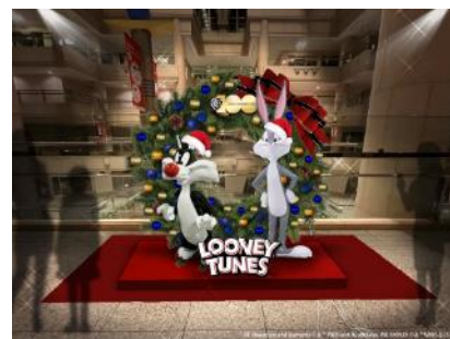
クリスマスフォトスポット ※画像はイメージです