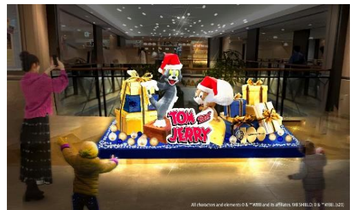
フォトスポット ※画像はイメージです

ツリーが展示されている10階には、「トムとジェリー」と「ルーニー・テューンズ」のスケッチ画(複製)を展示。アニメーションの空想世界を作り上げている緻密で繊細なスケッチを間近で体感することができます。11階には、「トムとジェリー」のフォトスポットを設置。メインツリーのイルミネーションと一体感のある写真を撮影することができます。