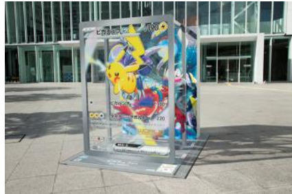
横浜市役所『ポリワール ex』展示の様子