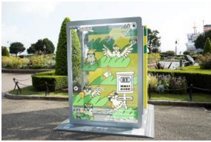
山下公園『ポリワール』展示の様子