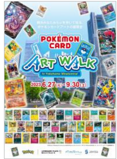
Pokémon Card Art Walk in Yokohama Minatomirai キービジュアル