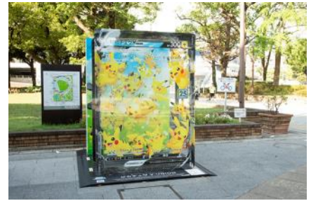
横浜公園『ポリワール V-UNION』展示の様子