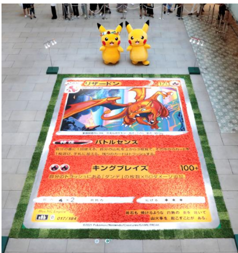
ポケモンカード フラワーカーペット - リザードン - 完成作品

『みんなで作る！ポケモンカード フラワーカーペット - リザードン -』は、MARK IS みなとみらいで8月31日(木)まで展示いたします。また、7月22日(土)にランドマークプラザで開催した、『みんなで作る！ポケモンカード フラワーカーペット - ピカチュウ -』は、9月30日(土)まで展示しています。ぜひ、巨大なポケモンカードのフラワーカーペット2作品を鑑賞しに、みなとみらいへお越しください。