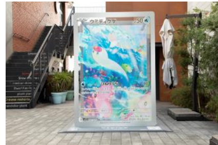
マリン アンド ウォーク ヨコハマ『ウミデギガ』展示の様子