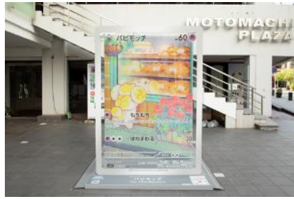
元町プラザ『ポリワール』展示の様子