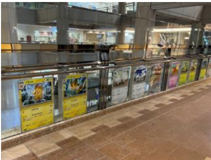
展示の様子(ランドマークプラザ)