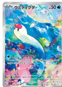
【ウミディグダ】 ⑤ マリン アンド ウォーク ヨコハマ