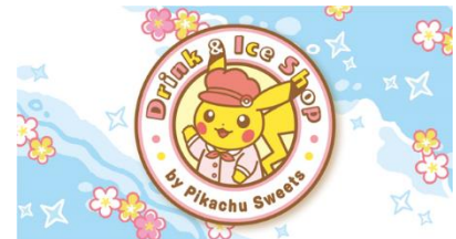
ドリンク&アイスショップ by ピカチュウスイーツ ロゴ

ピカチュウスイーツ by ポケモンカフェのポップアップショップ『ドリンク&アイスショップ by ピカチュウスイーツ』が、ランドマークプラザ、MARK IS みなとみらいにオープンします。