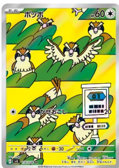
【ポップ】 ① 山下公園