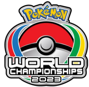
ポケモンワールドチャンピオンシップス 2023 ロゴ