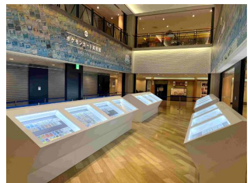
ポケモンカード 美術館 展示の様子