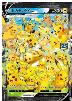
【ピカチュウV-UNION】 ③ 横浜公園