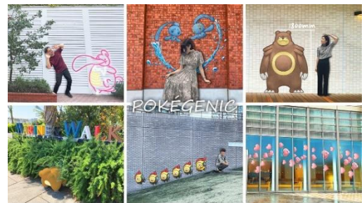
ポケジェニック イメージ

『ポケモンワールドチャンピオンシップス2023』の会場周辺では、開催をお祝いするようなアートや、様々なポケモンとフォトジェニックな写真が撮れるフォトスポットが各所に設置されます。ランドマークプラザ、MARK IS みなとみらいに設置されるフォトスポットを探して、写真を撮って、シェアしてお楽しみください。