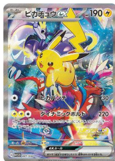
【ピカチュウex】 ④ 横浜市役所