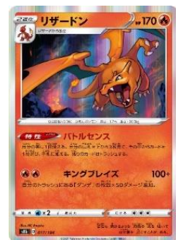
リザードンのポケモンカード イメージ

●特設サイトURL https://pokemon-card-artwalk.com/