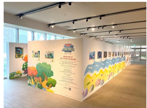
ポケモンカード 151 イラストコレクション 展示の様子