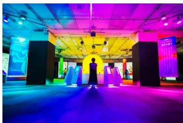
『POKÉMON COLORS YOKOHAMA』 イメージ

4つのアクティビティと1つのインスタレーションをポケモンと楽しむ体験型企画『POKÉMON COLORS YOKOHAMA』が、明日、7月26日(水)からランドマークプラザ5階 ランドマークホールで開催されます。豊かな色彩と音響に包まれた空間で、大画面に現れるポケモンと自転車をこいだり、釣りをしたり、体を動かしながら楽しむ新しい体験をお届けいたします。