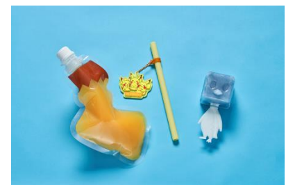
商品例：ピカチュウスイーツのピカピカサマーセット 2,400円(税込)

※「ドリンク&アイスショップ by ピカチュウスイーツ」は、<みなとみらい駅 未来チューブ(みなとみらい駅改札外コンコース)>にも登場いたします。 ※「ドリンク&アイスショップ by ピカチュウスイーツ」について、詳しくは ポケモンカフェ公式サイト をご確認ください。 ※内容は予告なく変更となる場合がございます。