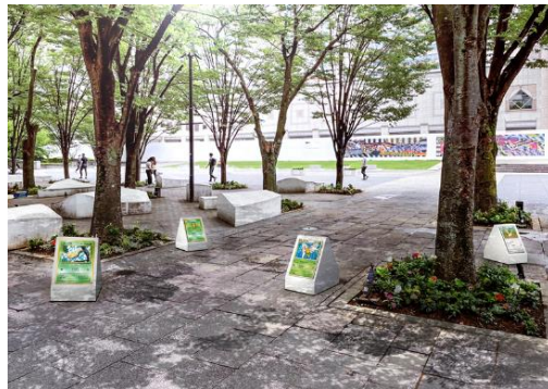
グランモール公園 展示イメージ