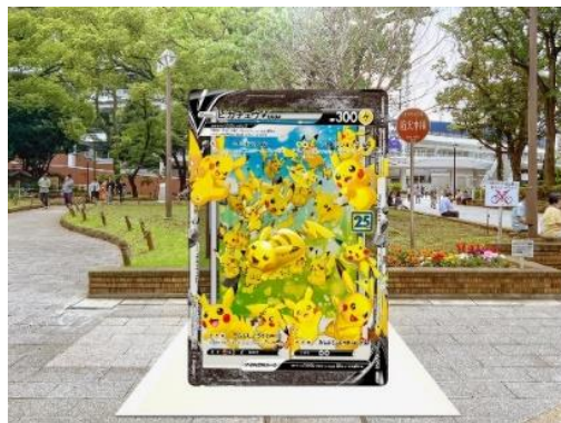
横浜公園 展示イメージ