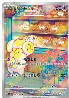
【パピモッチ】 ② 元町プラザ