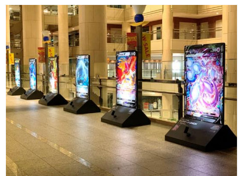
ポケモンカード 伝説の回廊 展示の様子