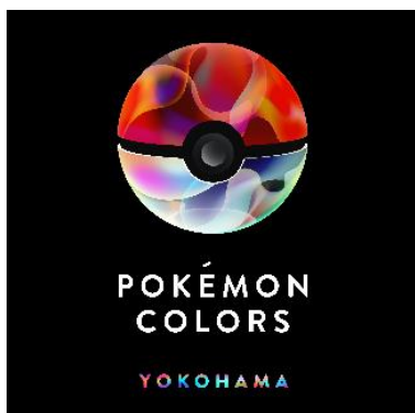
『POKÉMON COLORS YOKOHAMA』 ロゴ