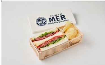
MER ロゴ入りランチボックス(パストラミビーフサンド)