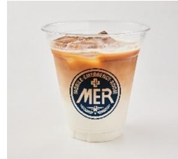
MER アイスカフェラテ