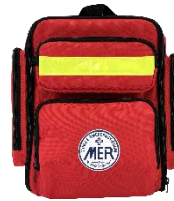
エマージェンシーレプリカバッグ/ 5,500円(税込)