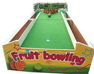
フルーツボーリング (イメージ)