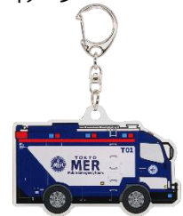
アクリルキーホルダー ERカー-T01/ 750円(税込)