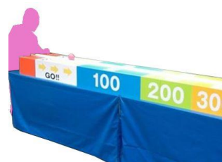
ボール寸止めゲーム (イメージ)