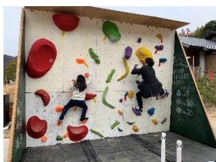
ボルダリング (イメージ)