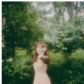
Saku (Somewhere) さん