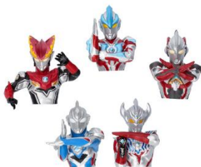
ウルトラマンフィギュアマグネット2 990円(税込)