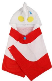
なりきりタオル ウルトラマン 3,080円(税込)

「ウルトラマンワールドM78 POP-UP STORE」では、5月13日(金)に全国公開される『シン・ウルトラマン』のグッズや、ビジネスシーンやご家庭でも使いやすいグッズやお子様楽しく遊ぶことのできるおもちゃなど、大人の方からお子様まで幅広く楽しんでいただけるような商品をご用意。ウルトラマンショップ限定のアイテムも多数取り揃えています。また、開催記念スペシャル企画として、お買い上げいただいた全てのお客様に特製ステッカーをプレゼントいたします。