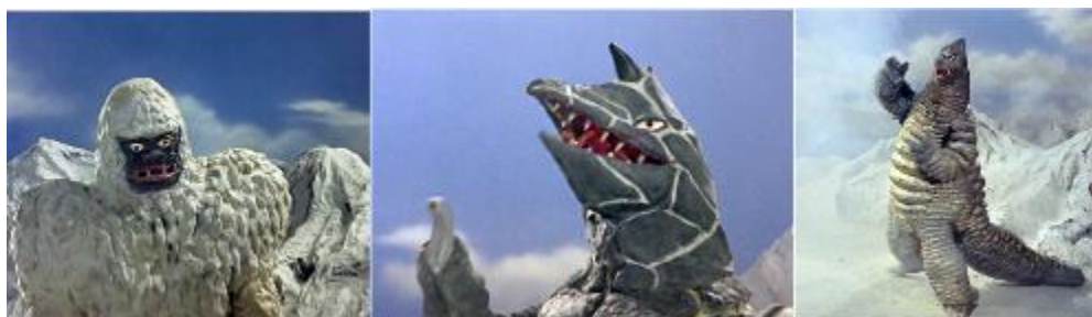
左から「冷凍怪獣ギガス」「彗星怪獣ドラコ」「どくろ怪獣レッドキング」