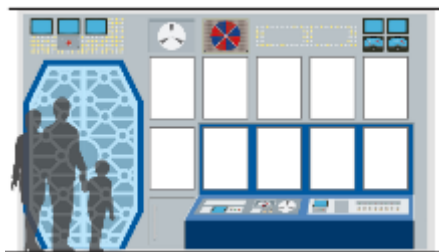
『ウルトラマン』 展示スペースイメージ