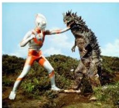
ベムラージオラマ イメージ