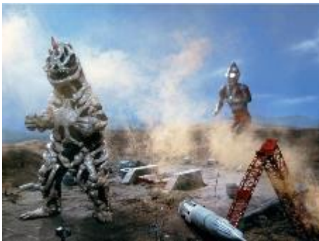
シーボーズのジオラマ※イメージ