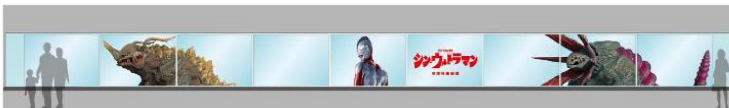
窓面装飾のイメージ

【場 所】 69階展望フロア スカイガーデン 【展示期間】 4月29日（金・祝）～6月30日（木）