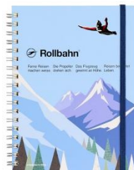
ロールbahnポケット付メモ ウルトラセブン 1,045円(税込)