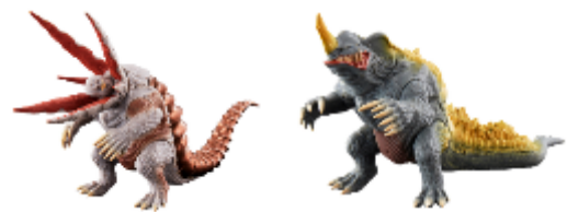
ムービーモンスターシリーズ