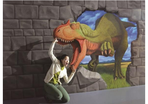
※画像はアロサウルスのイメージとなります。