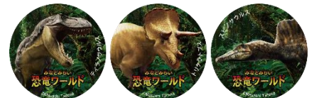
※イメージとなります。

【参加費】 特別入場チケット（通常の入場料に加え、+200円（税込））を購入していただくと、恐竜クイズとオリジナル恐竜缶バッジ（全3種類の中から一つ）をお渡しし、参加となります。