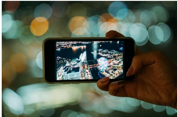
スカイガーデンからの夜景

11月26日（金）の18:30～20:00のスカイガーデンにて、自身のInstagramで9万人以上のフォロワーを抱える人気フォトグラファー「もろんのん」さんによる、一夜限りの特別なワークショップを開催いたします。みなとみらいのきらめく夜景が一望できるスカイガーデンで、夜景をより美しく撮影する写真テクニックや、Instagramで多くの「いいね」を獲得する写真のコツなどを、もろんのんさんが参加者に直接伝授する貴重な機会。カメラ好きはもちろん、スカイガーデンからの夜景をさらに魅力的に記録に残したいという方におすすめのワークショップです。