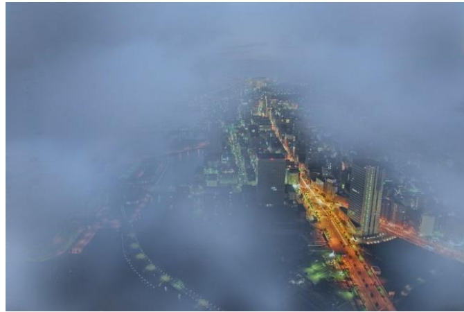
雨天時、眼下に雲を望むスカイガーデンからの景色（一例）

『新・雨の日キャンペーン』『新・視界ゼロキャンペーン』は、通常大人入場料金1,000円でご入場いただき、オリジナルポストカード1枚と、ドリンク1杯がもらえるお得なキャンペーンです。ドリンクは、生ビール、ハイボール、レモンサワー、ソフトドリンク、そしてキャンペーン開催時のみのご提供となるオリジナル限定ドリンク「雨奇晴好（うきせいこう）」の中から、好きなドリンクをお選びいただけます。当日、併設のスカイカフェにてドリンク引換券をお渡しにいただき、好きなドリンクをお召し上がりください。