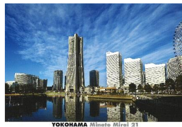
YOKOHAMA Bay City