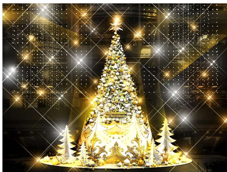
クリスマスツリーイメージ