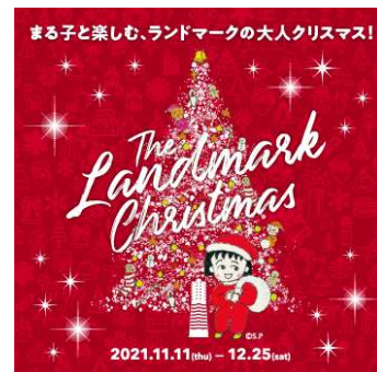
▲「The Landmark Christmas 2021」 キービジュアル