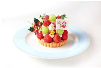
ちびまる子ちゃん クリスマスケーキ/果実園リーベル (ランドマークプラザ 5階) ¥4,950 果実園ならではのフルーツたっぷりクリスマスケーキ。あまおうをふんだんに使用し、シャインマスカットをあしらったちびまる子ちゃんとともに楽しいクリスマスタルトです。