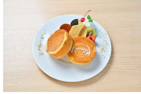
まる子のプリンアラモードパンケーキ/湘南パンケーキ (ランドマークプラザ 1階) ¥1,380 まるちゃんの好きなプリンをベースにパンケーキにもマッチするフルーツをトッピングしプリンアラモードスタイルに。マスカルポーネチーズとメレンゲを使ったフワフワパンケーキと合わせてお召し上がりください。