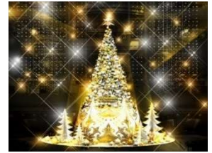
▲横浜ランドマークタワー 「Happiness Holidays Tree」イメージ

今年で原作35周年を迎えた国民的人気キャラクター「ちびまる子ちゃん」とコラボレーションし、ハートフルなコンテンツを各所で実施中です。ランドマークプラザ・MARK IS みなとみらいではデジタルスタンプラリーを展開するほか、ちびまる子ちゃんと仲間たちが館内各所に登場します。加えて、スマートフォンで楽しめるARコンテンツを今年も展開。館内設置のリーフレットにある二次元コードを読み取ると、ちびまる子ちゃんのクリスマスリースが出現する仕掛けとなっています。ご自宅でも、ちびまる子ちゃんとのクリスマスをお楽しみいただけます。