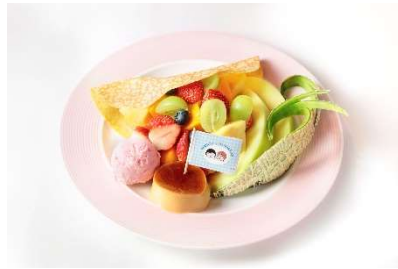
まる子とたまちゃんの仲良しプリンアラモード/ 果実園リーベル (ランドマークプラザ 5階) ¥2,530 果実園ならではのフルーツたっぷり使用したプリンアラモード。まるちゃんが大好きなプリン、たまちゃんが大好きなメロンとともにパンケーキとクレープを果実園らしくフルーツで彩ります。