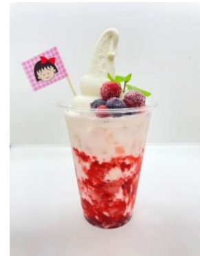
まるちゃんのいちごフロート/スカイカフェ (横浜ランドマークタワー 69階展望フロア 「スカイガーデン」内) ¥750 甘酸っぱいいちごとまろやかなミルクの華やかな味わい。バニラのソフトクリームとミックスベリーでトッピングしました。