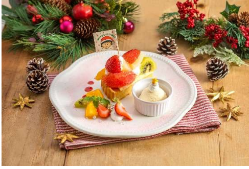
ちびまる子ちゃんのクリスマス・スペシャルプレート オリジナルポストカード付/ ラ・メゾン アンソレイユターブル (ランドマークプラザ 1階) ¥1,860 ラ・メゾンのお好きなタルトをクリスマス限定スペシャルプレートとして盛り合わせました。オリジナルデザインのポストカード付です。