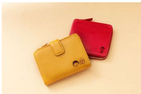
ちびまる子ちゃん刻印/BUSINESS LEATHER FACTORY (ランドマークプラザ 2 階) ¥1,100 ちびまる子ちゃんの7種類のイラストからお選びいただき、ビジネスレザーファクトリーでのご購入商品に刻印します。

【内 容】クリスマス期間限定で対象の店舗でちびまる子ちゃんコラボメニュー・コラボ商品を楽しめる。