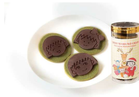
ちびまる子ちゃんの抹茶サブレ/CHOCOLABO (ランドマークプラザ 1 階) ¥1,404 ちびまる子ちゃんの形をしたチョコレートを抹茶のサブレに合わせ、美味しさを感じるこだわりの厚みに。サブレには作者のさくらももこさんの出身地の静岡県産抹茶を使用しています。可愛らしいちびまる子ちゃんの表情とサクサクの抹茶のサブレをお楽しみください。