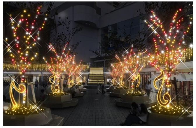
(16) クイーンズパーク