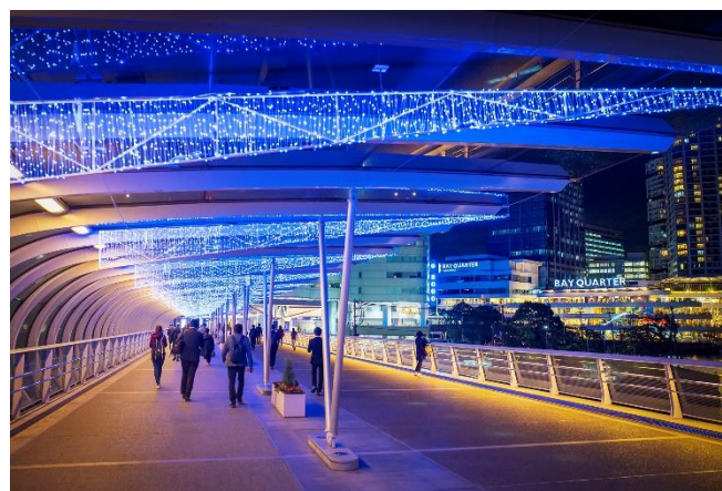
(4) はまみらいウォーク