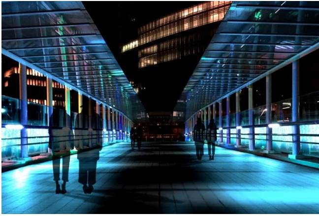
(5) みなとみらい歩道橋