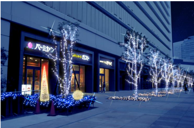
(7) 横浜アイマークプレイス