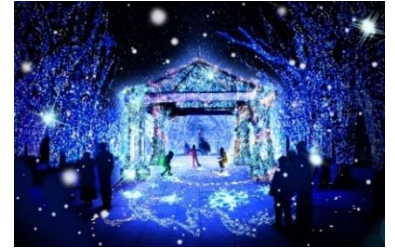
(10) トリス「LIGHT OF HOPE」 (イメージ)