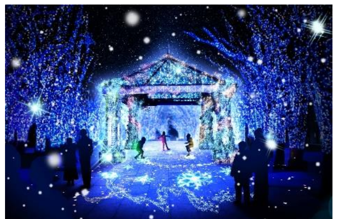
(10) トリス「LIGHT OF HOPE」(イメージ)

メインコンテンツとして、床面に投影された“希望の星屑”に触れると、イルミネーションが音に合わせて光り輝く体感型インタラクティブ・イルミネーション『LIGHT OF HOPE ～広がる希望の光～』がグランモール公園「美術の広場」に登場するほか、医療従事者をはじめ、コロナ禍で奮闘する人々への感謝の気持ちを込めて、子供達からメッセージを贈るハートフルな企画『Messages from Yokohama Milight children』も実施します。