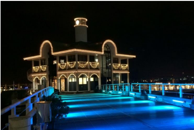
(17) ぶかりさん橋 (パシフィコ横浜)