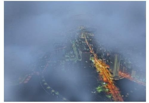
雨天時、眼下に雲を望むスカイガーデンからの景色(一例)

曇りや雨などの天候により横浜ランドマークタワーからの視界が悪い休日限定で、入場料が700円になるほか、スカイガーデン内の「スカイカフェ」にてワンドリンク（各種ソフトドリンク、ビール、レモンサワー、ハイボール等）をサービスします。