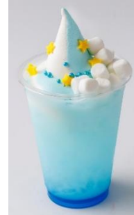
スカイソフトクリーム 400円 / オリジナルカクテル(スカイビュー) 800円 / スカイフロート 600円 (※全て税込み)