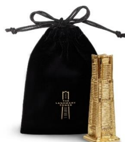
タワーオブジェ ゴールド 2,750円 (税込み)