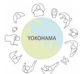
ダイアグラム2 (多角的なコンテンツターゲット)