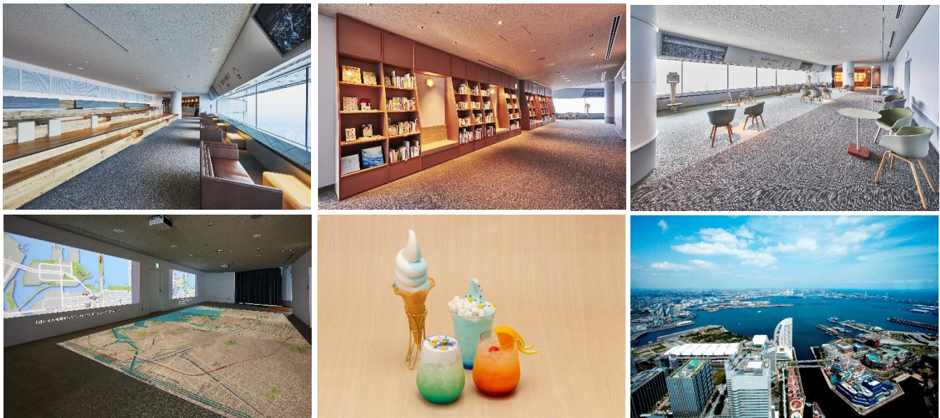
(左上) スカイガーデン/ (中央上) 横浜・空の図書室/ (右上) スカイガーデン北西 / (左下) 空中散歩マップ/ (中央下) スカイカフェオリジナルメニュー/ (右下) スカイガーデンからの眺望

梅雨真ただ中この季節、新たに新設されたコンセプト型ライブラリーの本を片手にドリンクを飲みながらゆったりとしたひと時をスカイガーデンでお過ごしください。