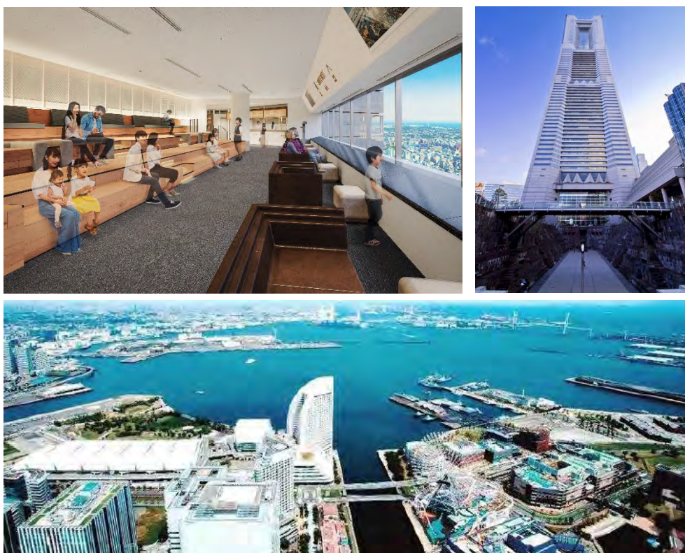
(左上) リニューアル後のイメージベース (スカイカフェ) / (右上) ランドマークタワー外観 / (下) スカイガーデンからの眺望

三菱地所株式会社と三菱地所プロパティマネジメント株式会社は、開業から26年間で累計約2,400万人が来場した横浜ランドマークタワー 69F展望フロア「スカイガーデン」を、「YOKOHAMA360°」をコンセプトとし、地上273mの高さから地元横浜・神奈川の魅力を発信する起点となるべく2020年4月25日（土）にリニューアルオープンします。「スカイガーデン」は今回のリニューアルを通じ、横浜を訪れたらまず初めに足を運びたい観光スポットへ、そして、来訪をきっかけに一層横浜・神奈川の街を知り歩きたい場所へ、さらには横浜・神奈川で暮らし働く多世代の人々にとって地元がより好きになる憩いの場へと生まれ変わります。三菱地所グループは、今後も様々な事業を通じて、みなとみらい21地区がより創造的かつ魅力的な街になるべく貢献してまいります。