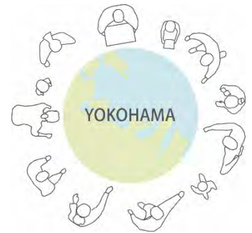
ダイアグラム 2 (多角的なコンテンツとターゲット)