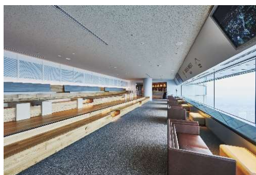
スカイカフェ / オリジナルカクテル（横浜サンセット）800円（税込み） / スカイガーデン