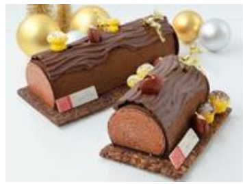
ビュッシュ・ショコラ・エキゾチック

<ラ・メゾン アンソレイユターブル『タルト・フリーズ』> ランドマークプラザ1階/カフェ・レストラン