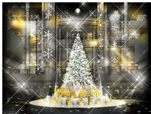
『The Landmark Christmas 2020』キービジュアル / クリスマスツリーイメージ

11月14日（土）には、同会場にて横浜文化プログラム2020（主催：横浜アーツフェスティバル実行委員会）の「神奈川フィルハーモニー管弦楽団」によるコンサートが行われます。吹き抜け空間を活かした壮大なクリスマス装飾と、地域が誇るオーケストラによる生演奏をぜひお楽しみください。