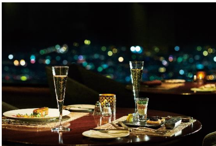
70階 スカイラウンジ シリウス ※画像はイメージ

抽選で横浜ロイヤルパークホテルのペアお食事券や、ランドマークプラザギフトチケットが当たる応募ハガキを、対象店舗にて税込3,000円以上お買い上げのお客様に、プレゼントいたします。応募ハガキは、館内に設置する応募BOXにご投函していただくか、切手を貼付してポストにご投函ください。