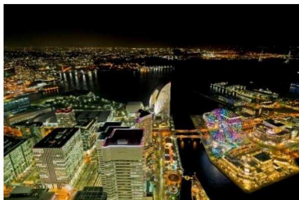
横浜ランドマークタワー 69階展望フロア スカイガーデン

2020年6月にリニューアルオープンした69階展望フロアスカイガーデンでは、夕日が沈みゆく富士山を眺めながら夜を待つと、眼下には360°広がるみなとみらいの夜景を望むことができます。併設するスカイカフェでは、ソフトクリーム「天空」や、スカイガーデンから見渡す空をイメージしたオリジナルカクテルなどをお楽しみいただけます。クリスマスムード満点の煌びやかなみなとみらいの街並みを、上空273mからご堪能ください。