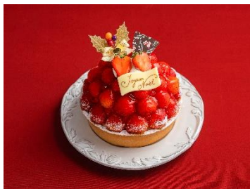
タルト・フリーズ