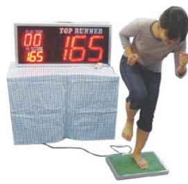
「ダッシュチャレンジ」(MARK IS みなとみらい)