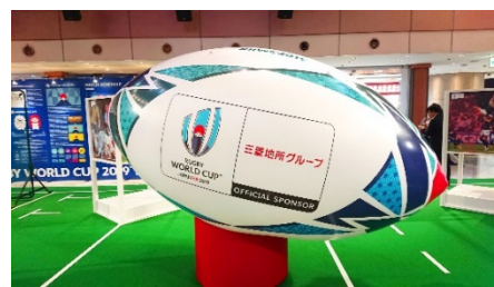
「巨大ラグビーボール」(スカイビル)