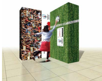
「トライフォト」(ランドマークプラザ)