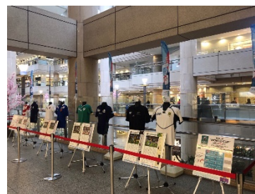
「ラグビーワールドカップ 2019™ 出場国・地域代表ユニフォーム展示」