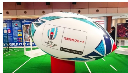
※画像はすべてイメージです。